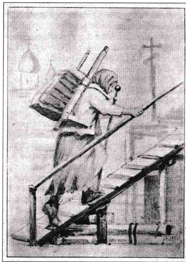
Sfânta Xenia cărând cărămizi – ilustrație din 1907, realizată pentru prima carte cu mărturiile ale minunilor sale

Cei care fuseseră însărcinați cu urmărirea Xeniei pe o perioadă mai îndelungată, au dat mărturie limpede și amănunțită despre felul în care se desfășura „viața de noapte” a acestei cerșetoare. Indiferent de anotimp sau de cât de vitregă era vremea afară, în timpul nopții, Sfânta Xenia ieșea pe un câmp în afara orașului și, așezându-se în genunchi,